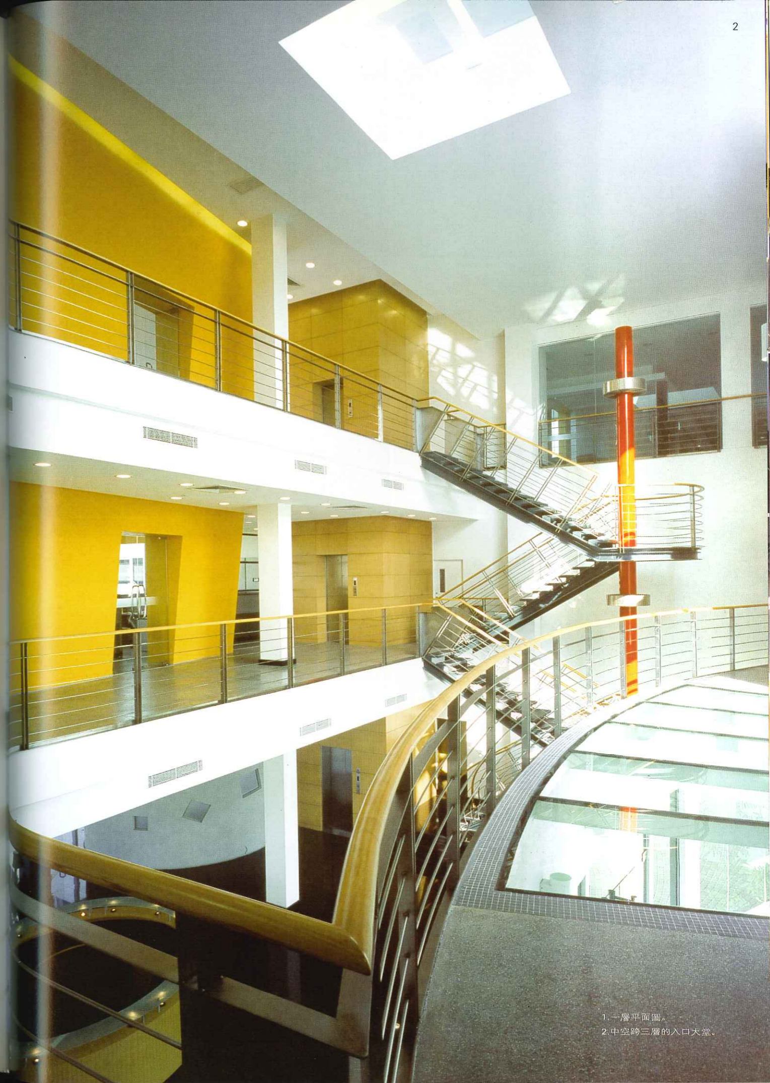
1. 一層平面圖。 2. 中空跨三層的入口大堂。